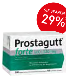
Prostagutt® forte Kapseln – 200 Stück