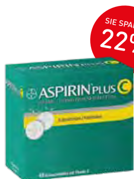
Aspirin plus C* Brausetabletten – 40 Stück