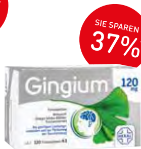
Gingium® 120 mg Filmtabletten – 120 Stück